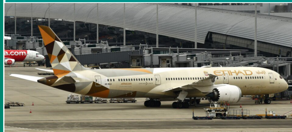
ETIHAD Airways B787-9