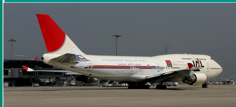
JAL/B747-446 国際線就航50周年記念塗装 写真提供・解説：元・住重関西施設管理(株) 片山敏彦 様

JALは、1954年2月の国際線初就航(羽田～ホノルル経由～サンフランシスコ便)から70周年を迎えますが、その記念として来年1月に同一航路でチャーター便を運航するそうです。本機は、胴体に国際線初就航時に使用されていたDC-6Bを実物大で描いた50周年記念塗装のB747ですが、DC-6Bとジャンボ機との大きさの違いがよくわかります。本機は、旅客機としての役目を終え貨物機に改修されましたが、2010年にアメリカ/カリフォルニアに移籍し、現在も貨物機として活躍しています。