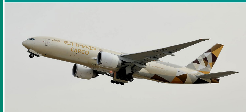
Etihad Airways B777-FFX