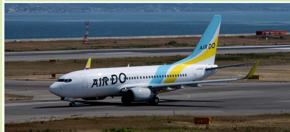
AIR DO/B737-781

AIR DOは、札幌に本社を置き、羽田から札幌、函館など北海道の各地へ、また神戸から札幌への国内線を運航しています。ANAとは、経営支援やコードシェアなどで密接な関係にあり、ANAから移管されたB767/B737で運航しています。関空には就航していませんが、このB737のようにテストフライトで何回か飛来しています。