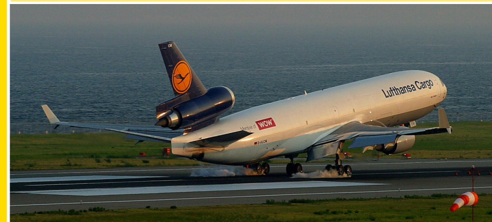
Lufthansa Cargo MD-11F

関空でもお馴染みのルフトハンザ・カーゴのMD-11Fですが、ボーイングB777Fの導入に伴ない退役が進んでおり(関空便は、すでにB777Fに変更済)、最後のMD-11Fが2021年10月をもって退役するそうです。これで旅客型を含め欧州ではMD-11は全て姿を消すことになるそうですが、関空ではいまだFedExのMD-11Fが頑張っている姿を見ることができます。