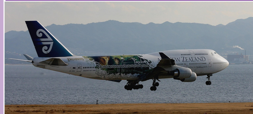
Air New Zealand /B747-419