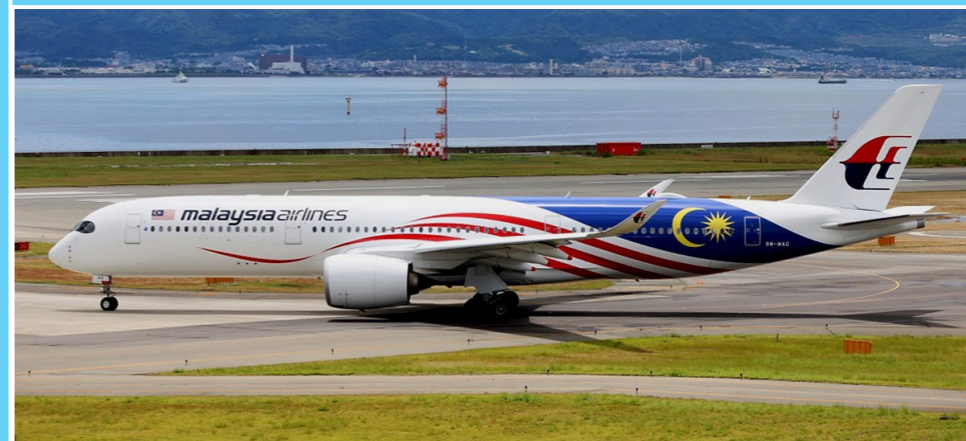
マレーシア航空/A350-941XWB 「ネガラク」

マレーシア航空は、7月23日より関空～クアラルンプール線にA350-900を投入しました。本機は、現在6機保有しているA350のうち3機に塗装されている「ネガラク」と呼ばれる特別塗装です。「ネガラク」とはマレーシアの国歌「わが祖国」という意味だそうで、胴体後部にマレーシアの国旗がデザインされています。